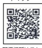
配備場所はこちら (区ホームページ)