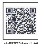
中野区洪水ハザードマップ

区民の皆さんに安全・迅速に避難していただくことにより、洪水による被害を最小限にするため「中野区洪水ハザードマップ」を作成し、公開しています。区ホームページ上に掲載するとともに、防災対策係・各区民センターで配布しています。